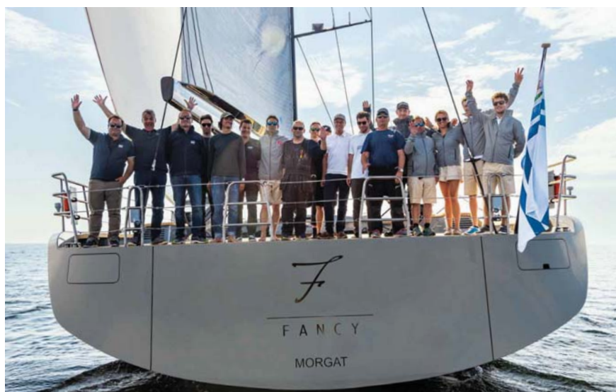
Během testovací plavby byl na palubě tým, který se na vývoji a dokončení jachty podílel.

polohy. Důvodem je zlepšení viditelnosti a kontroly nad jachtou. Navíc je zadní část kokpitu zcela k dispozici pro opalování a odpočinek.