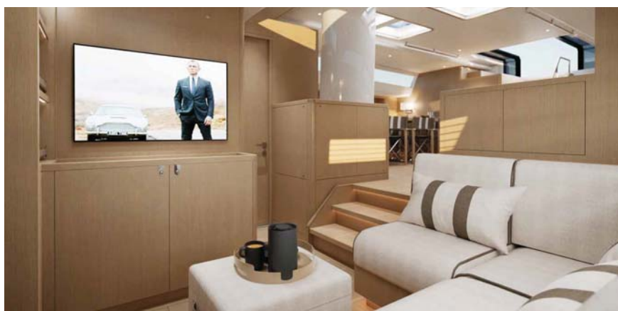
Design interiéru pojmenovaný Spirit of Finland.

Samotná návrhářka při představování lodi řekla, že jejími třemi hlavními pilíři při navrhování lodí