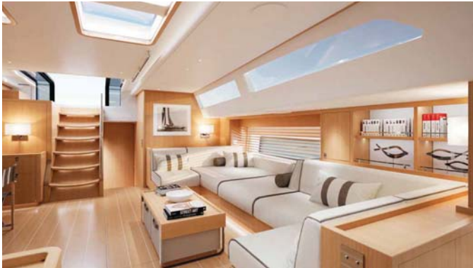
Spirit of Finland