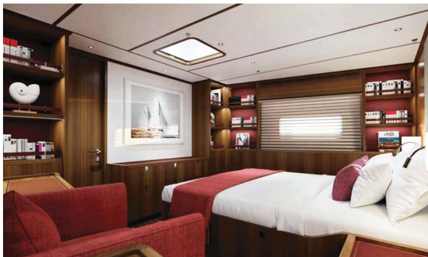
Kajuty pro hosty jsou útulné a stylové.

Swan jsou vzduch, světlo a prostor: „Volím světlé barvy pro představu o šíři a tmavé barvy pro intimnější atmosféru. Vše by mělo navodit představu ponoření do světlého prostoru v dokonalé harmonii s exteriérem.“