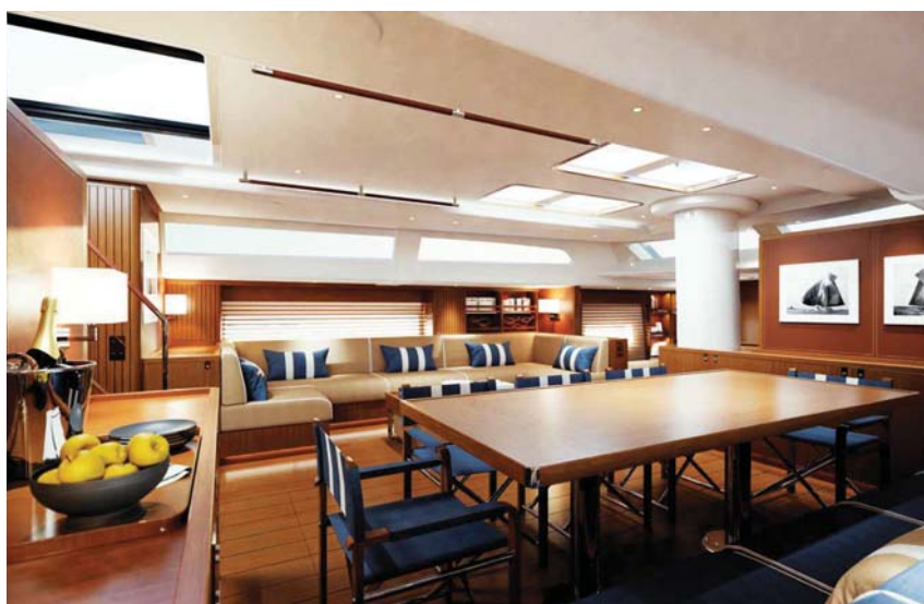
Prostorný salon nabízí sezení jak u jídelního stolu, tak na pohodlné pohovce.