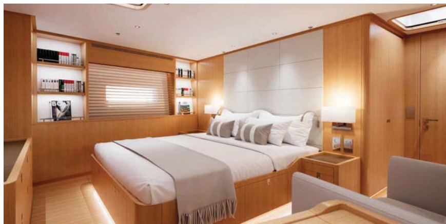
Majitelská kajuta ve stylu Spirit of Finland