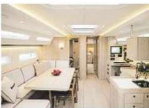
Confort sobre el mar A la izquierda, espectacular Swan 108, último modelo. Lujo y detalles en alta mar

—Cada verano, Costa Smeralda reúne a una élite apasionada de los ‘cisnes del mar’, los Swan, de la mano de Leonardo Ferragamo —