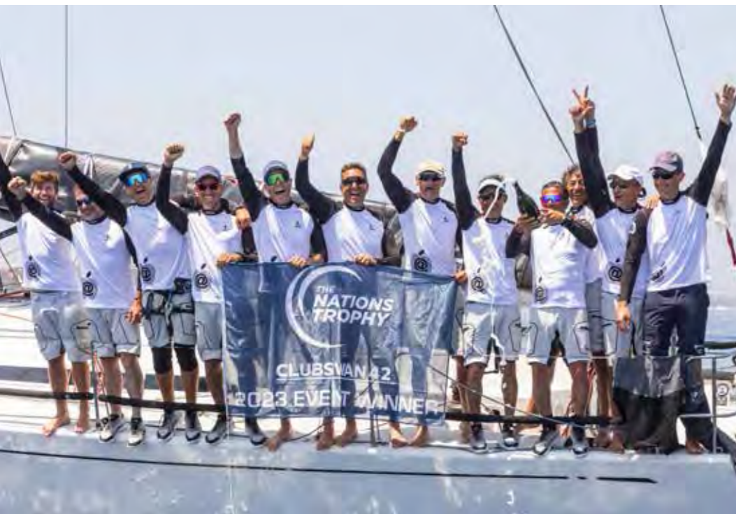
FROM TOP TO BOTTOM: CLUBSWAN 50 HATARI, CLUBSWAN 42 MELA AND CLUBSWAN 36 GSPOT