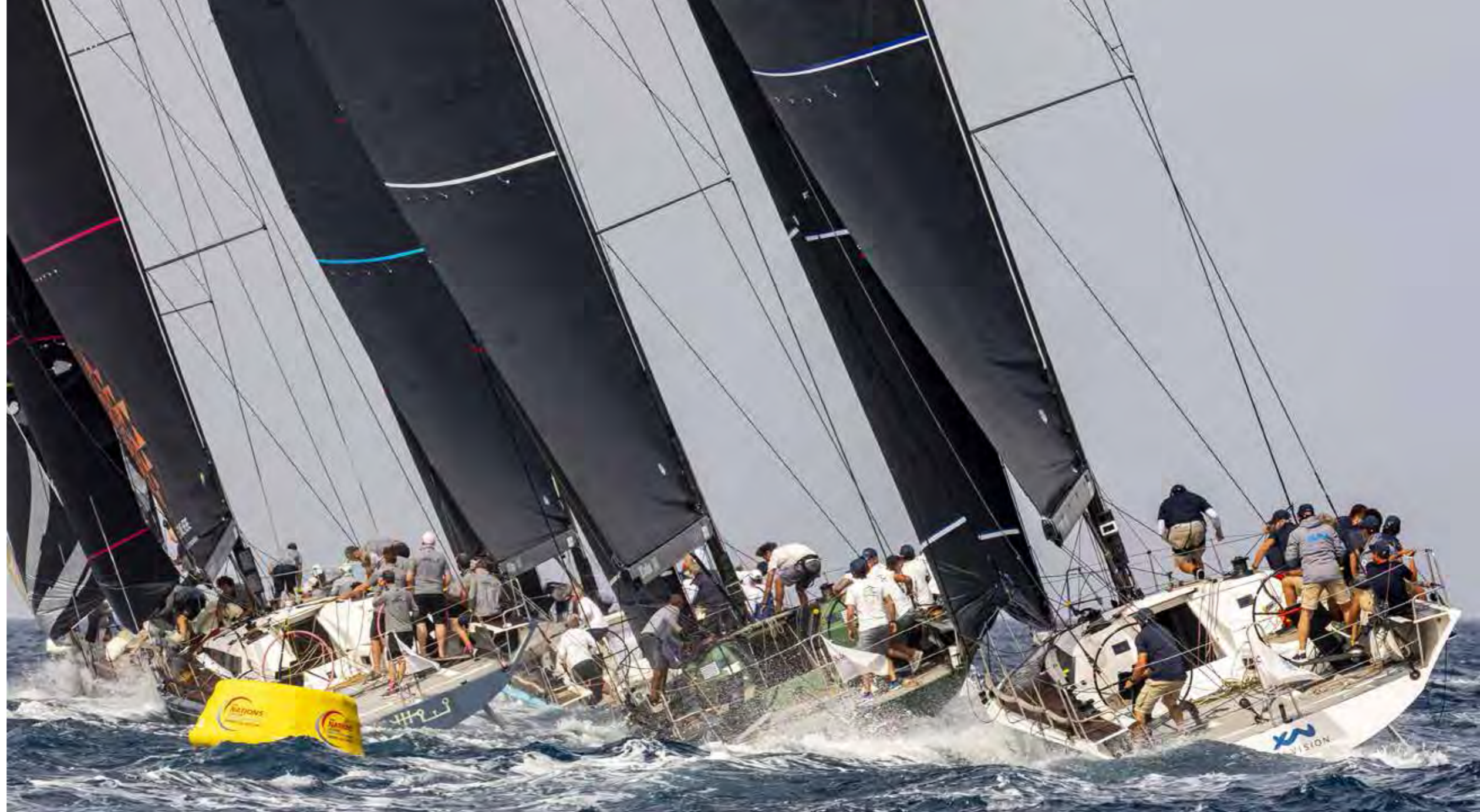
MOMENTS OF FIERCE COMPETITION IN PORTO CERVO CRYSTAL WATERS